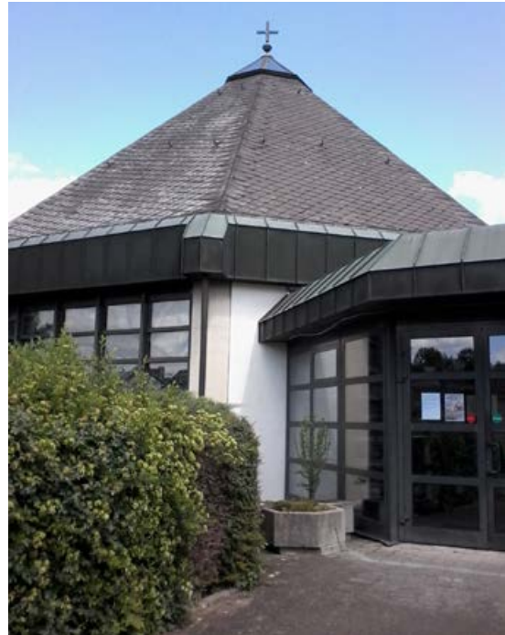
Zwei vergleichsweise junge Gemeindezentren: die Trinitatiskirche in der Eduard-Wolff-Straße Schötmar (links) und die Versöhnungskirche in Knetterheide

◆ Gemeinsam auf dem Weg: Moderierte Konferenz