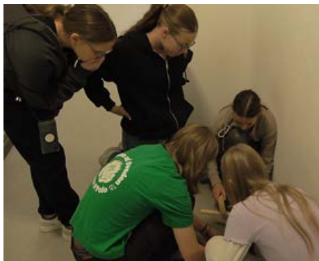
Gutes Teamwork ist angesagt bei den ZDF-Games beim Konfi-Castle

Im Mai wird dazu eine Benachrichtigung nebst Anmeldeformular versendet werden. Ansonsten können die Unterlagen zur Anmeldung auch telefonisch unter Telefon 05222/7718 angefordert werden.