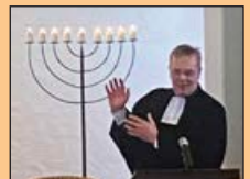
Der „Lasup“ predigt beim Jubiläum Seite 18