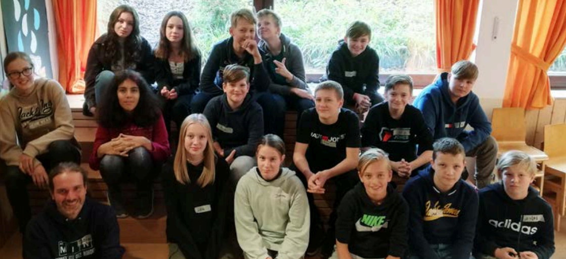
Die Konfirmandinnen und Konfirmanden des aktuellen Konfi-Jahrgangs.

■ Konfirmation an zwei Sonntagen in der Nordstraße