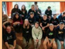
Geschafft: Die Konfirmation steht an Seite 4